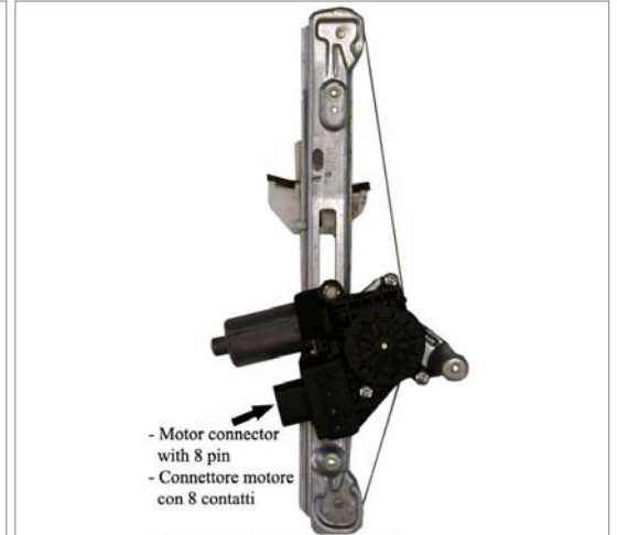
- Motor connector with 8 pin - Connettore motore con 8 contatti