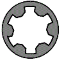
152.420 M 10x1,25x163

Schraubenkopf / Head shape Anziehreihenfolge/Tightening sequence/Ordre de serrage/Orden de apriete Tête de vis / Cabeza de tornillo