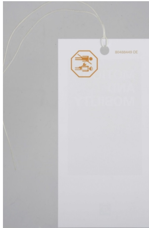
Abb./Fig. 2: Ersatzteilhänger Rückseite / Spare parts tag, back side / face arrière de l'étiquette de pièce de rechange / parte trasera de la etiqueta del repuesto