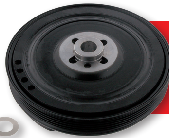
Rep. Satz Riemenscheibe