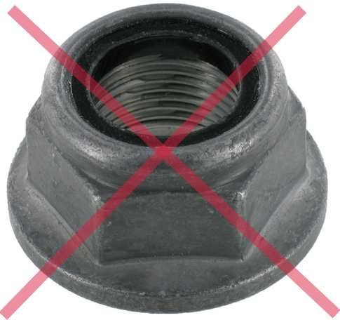
Alte Befestigungsmutter design