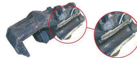
Gehäuse gebrochen / housing broken