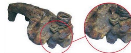
Starke Korrosion / strong corrosion