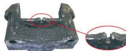
Aufnahme gebrochen / mounting broken