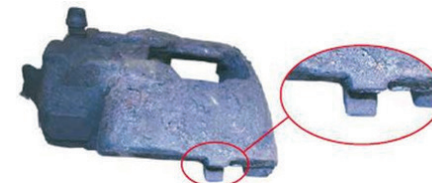
Befestigung gebrochen / mounting broken bracket