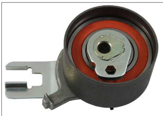
Bild 2: 531 0515 10 – Alte Spannrolle

Ersatzteile und technische Informationen finden Sie unter www.schaeffler-aftermarket.de oder www.RepXpert.com