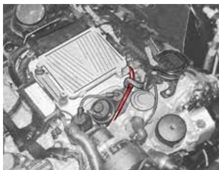
Motorraum W211 mit Leitung der Motorentlüftung (hervorgehoben)