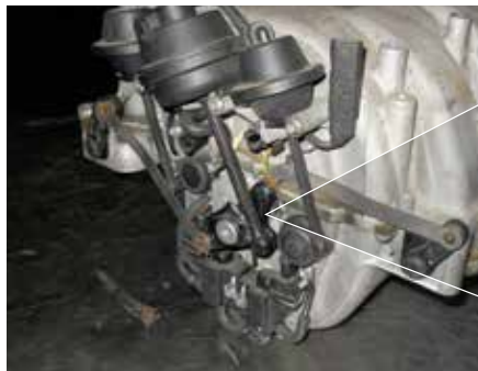
Schadensbild: Bruch am Schaltgestänge