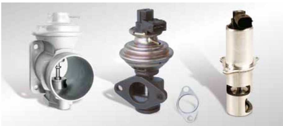
AGR-Ventile in Dieselfahrzeugen haben aufgrund der hohen Rückführraten große Öffnungsquerschnitte.

Elektrische oder elektromotorische AGR-Ventile werden direkt vom Steuergerät angesteuert und benötigen keinen Unterdruck und kein Magnetventil mehr.