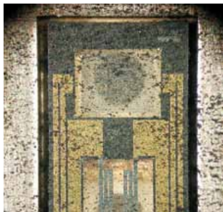
Salz und Schmutz können den Sensor eines Luftmassensensors schädigen – zumindest aber verfälschen sie die Messungen, was sich wiederum auf die AGR auswirken kann.