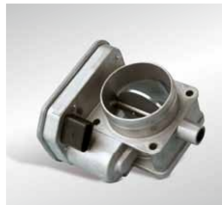
Da bei Dieselfahrzeugen die Druckdifferenz zwischen Abgas- und Saugseite für die hohen Abgasrückführraten nicht ausreicht, werden "Regelklappen" im Saugrohr eingesetzt, um den nötigen Unterdruck zu erzeugen.