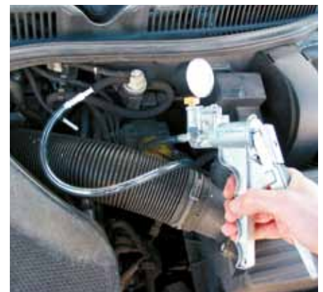
Ob pneumatische AGR-Ventile oder wie hier ein EPW: mit einer Handunterdruckpumpe lässt sich die Funktion leicht prüfen.