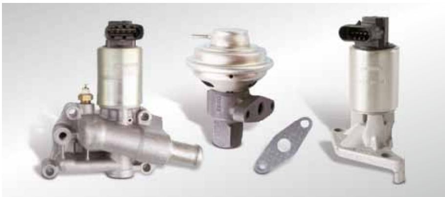
Bei AGR-Ventilen im Ottomotor sind die Querschnitte deutlich kleiner.

Rechts: elektrisches AGR-Doppeltellerventil