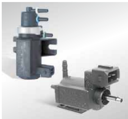
Mit Hilfe von elektropneumatischen Ventilen werden pneumatische AGR-Ventile angesteuert.