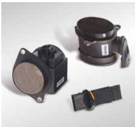
Der Luftmassensensor ist bei Dieselmotoren unter anderem für die Regelung der Abgasrückführung erforderlich.