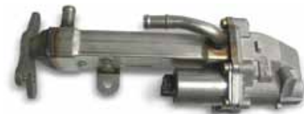
Abb. 1 AGR-Ventil mit AGR-Kühler

Seit Einführung der Abgasnorm Euro 4 kommen zunehmend AGR-Systeme mit AGR-Kühlern zum Einsatz (siehe auch PIERBURG Service Information SI 0108). AGR-Kühler sind keine typischen Verschleißteile. Trotzdem kann es im Verlauf eines Motorlebens zu einem Ausfall des AGR-Kühlers kommen.