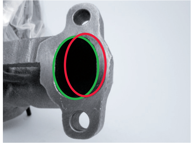
Őekil2: mek 030TC15116000: kırmızı elips: yanlış pozisyon, yeřil elips: doęru pozisyon