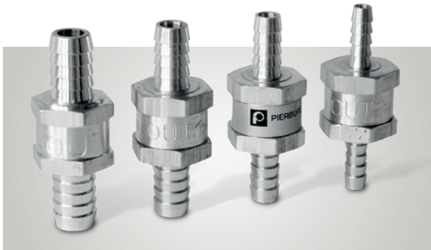
Kraftstoff-Rückschlagventile 6–12 mm

Keine Materialpaarungen verwenden, die mit Aluminium Korrosion oder Kontaktkorrosion auslösen z. B. Salzwasser oder verzinkte Oberflächen.