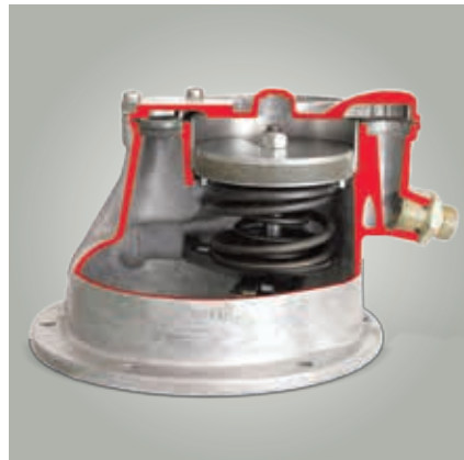
Eine klassische Kolbenvakuumpumpe (Schnittmodell)

Neue Entwicklungen gehen dahin, Förderpumpen für verschiedene Medien zu kombinieren (Tandempumpen): Kombinierte Kraftstoff-/Vakuumpumpen sitzen auf einer gemeinsamen Achse mit der Nockenwelle. Kombinierte Vakuum-/Ölpumpen sind in der Ölwanne montiert.