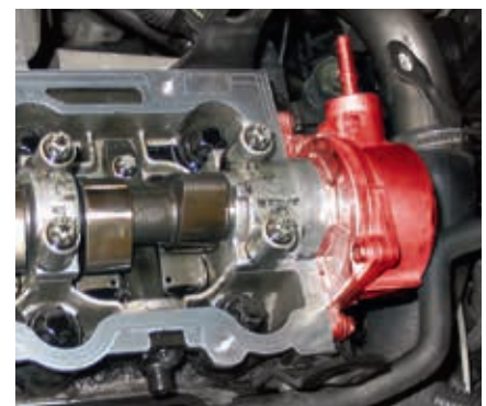
Vakuumpumpe und Nockenwelle im Opel Vectra B (hervorgehoben)