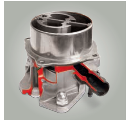
Stand der Technik: Einflügel-Vakuumpumpe (Schnittmodell)