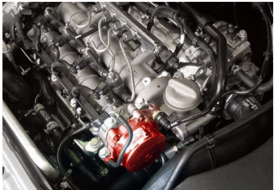
Vakuumpumpe im Opel Vectra B (hervorgehoben)

Da ein Ausfall der Bremskraftunterstützung zu einer gefährlichen Situation führen kann, gilt die Vakuumpumpe als Sicherheitsbauteil.