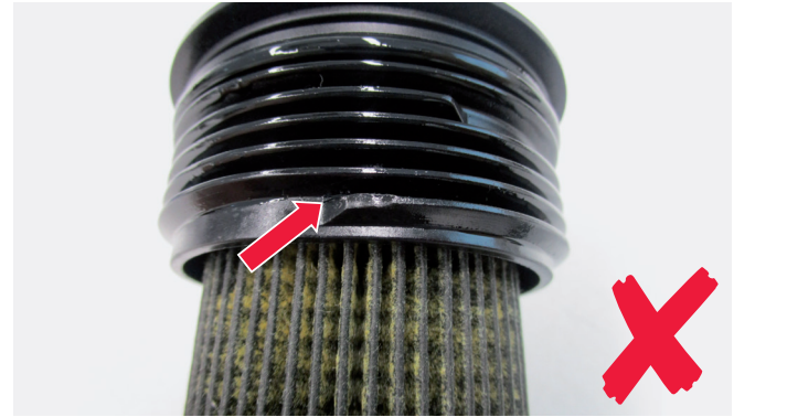
Resim 4: Hasar görmüş vida dişi

Önemli: Üretici bilgilerine riayet edebilmek için, filtre değişimi sırasında daima tork anahtarı kullanılmalıdır! Hasarları önlemek için, yeni contalar montaj işleminden önce temiz motor yağı ile yağlanmalıdır.