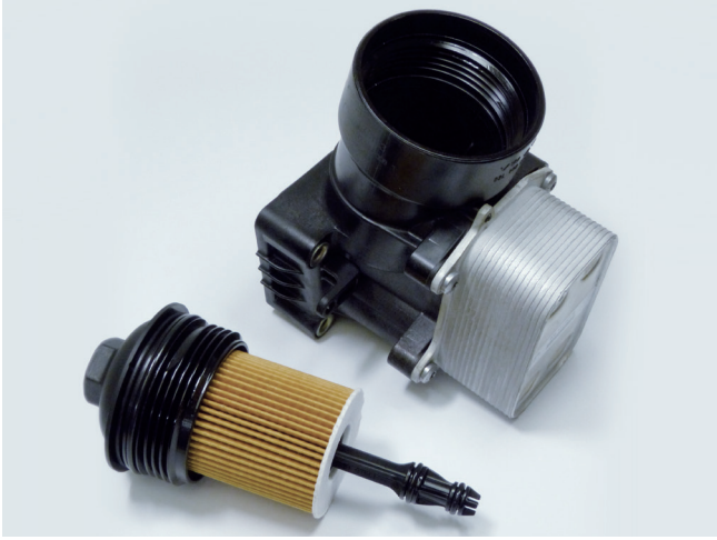
Resim 1: OX 388D ECO yağ filtresi elemanı ile birlikte yağ filtresi modülü

Bu işlem sırasında çok fazla kuvvet uygulanması, vida dişinin hasar görmesine ve kapağın deforme olmasına