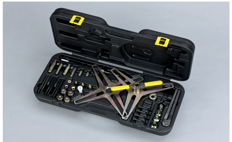
Bild 2: Das Spezialwerkzeug 400 0237 10 ermöglicht eine professionelle Kupplungsreparatur

Bei Reparatur- und Wartungsarbeiten an Kupplungen empfiehlt Schaeffler Aftermarket grundsätzlich das Spezialwerkzeug mit der Art.-Nr.: 400 0237 10 zu verwenden. Hinweise zur Handhabung des Werkzeugs sind unter www.repxpert.de zu finden.